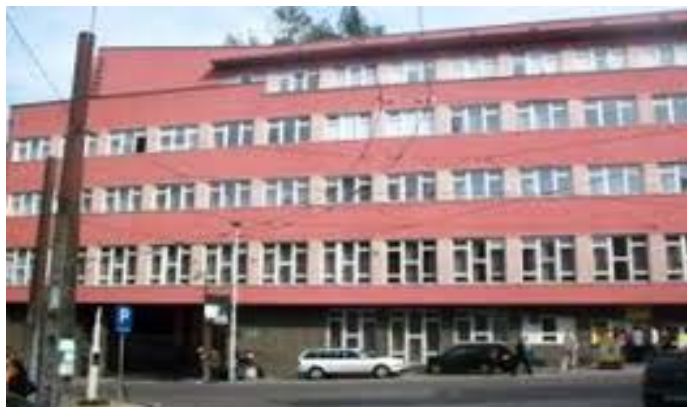
Akademija nauka i umjetnosti Bosne i Hercegovine